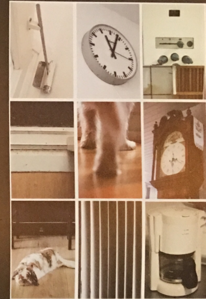
Afbeeldingen van soundclips huisgeluiden op de website elisethart.com.

'Nou, een van de dingen die voortgekomen zijn uit dat project, is