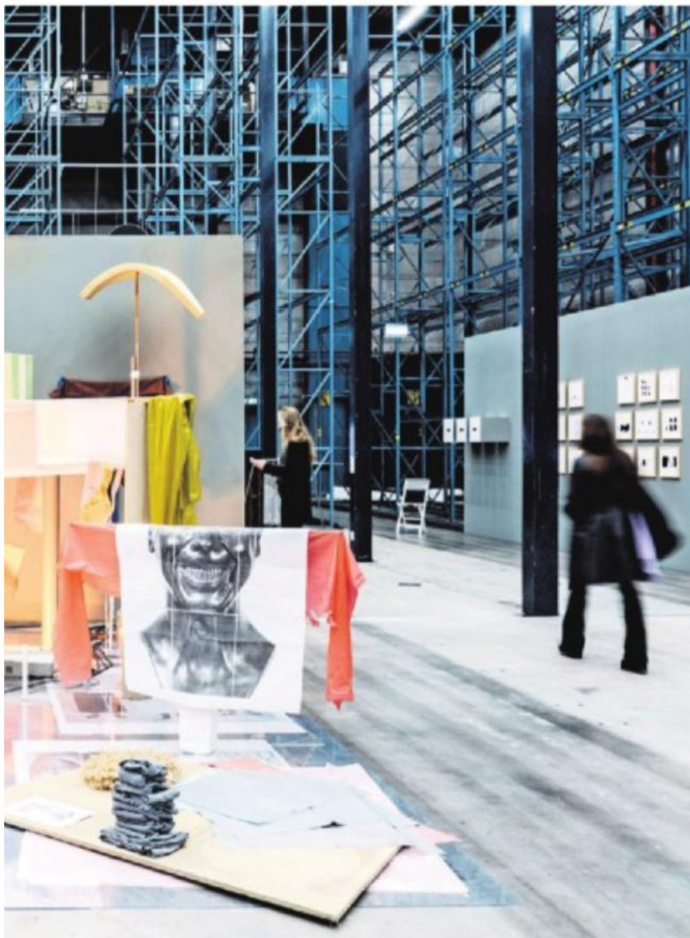
→ Deel van de expositie Prospects & Concepts , waar werk is te zien van 67 beeldend kunstenaars die in 2017 een Werkbijdrage Jong Talent hebben ontvangen.

Het Mondriaan Fonds is opnieuw present met Prospects & Concepts , waarop werk te zien is van 67 beeldend kunstenaars die in 2017 een Werkbijdrage Jong Talent hebben ontvangen. Een van die jonge, veelbelovende kunstenaars is Elise 't Hart, de eerste artist in residence van het Meertens Instituut en oprichter van het Instituut voor Huisgeluid, dat alledaagse geluiden verzamelt en archiveert.